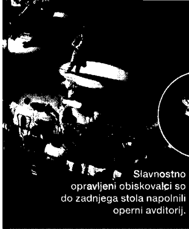
Slavnostno opravljeni obiskovalci so do zadnjega stola napolnili operni avditorij.