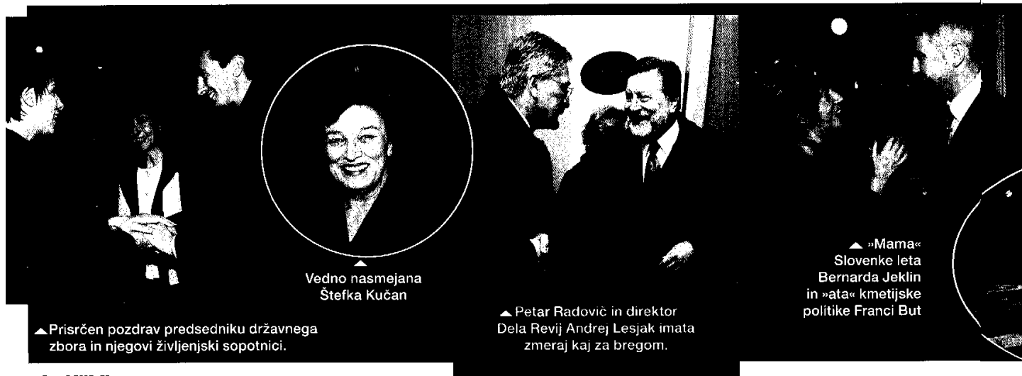
▲ Vedno nasmejana Stefka Kučan